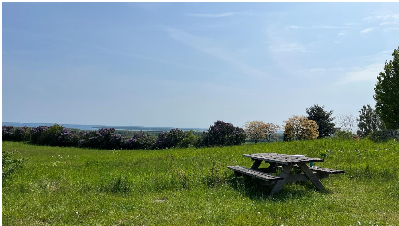
Udsigt mod øst fra Bregninge Kirke, hvor Langeland kan ses i kystlandskabet. X

I hele lokalområdet er landskabet udpeget som bevaringsværdigt landskab, ligesom en stor del af området er udpeget som særligt kulturmiljø. Samtidig fremstår landskabet uden visuelle forstyrrelser i form af tekniske anlæg. Det vidner om et lokalområde med store landskabelige og kulturhistoriske kvaliteter, der rummer et særligt potentiale for både bosætning og turisme.